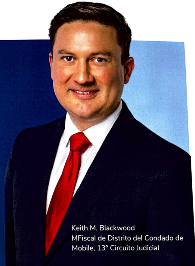
Keith M. Blackwood MFiscal de Distrito del Condado de Mobile, 13° Circuito Judicial

Conectar a las familias con los recursos en un esfuerzo por fortalecer a las familias, mejorar el comportamiento de los estudiantes y la participación académica antes de que las familias se encuentren con el sistema de justicia juvenil.