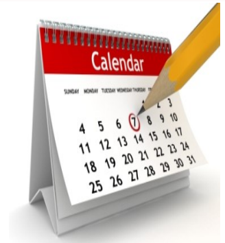
¡Fechas importantes para recordar!