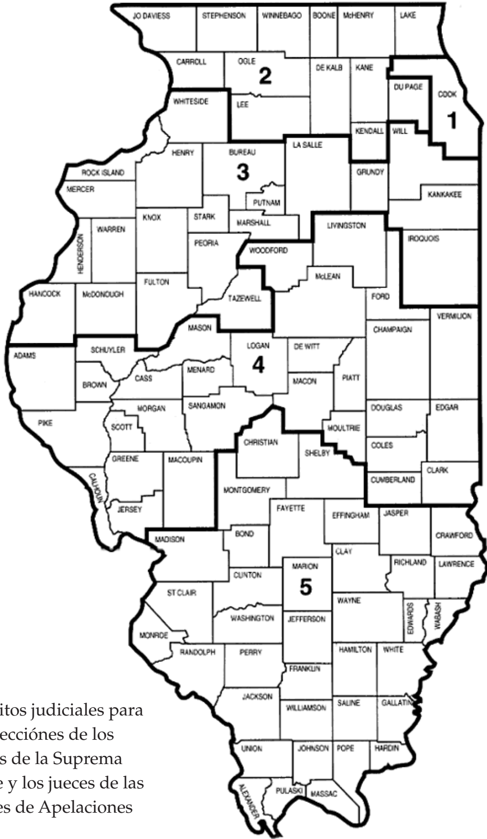
Districtos judiciales para las elecciones de los jueces de la Suprema Corte y los jueces de las Cortes de Apelaciones